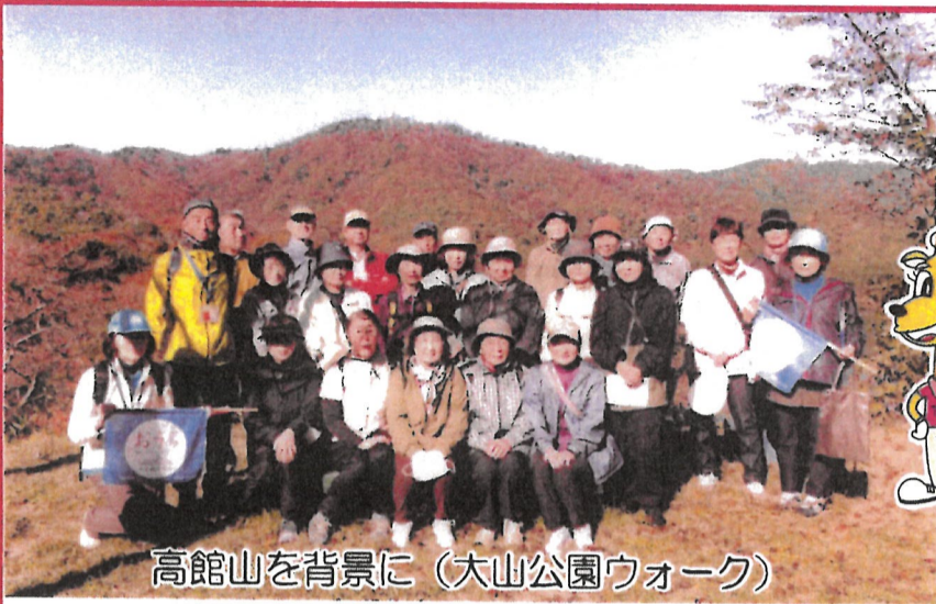
高館山を背景に (大山公園ウォーク)