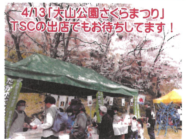
4/13「大山公園さくらまつり」 TSCの出店でもお待ちしております!