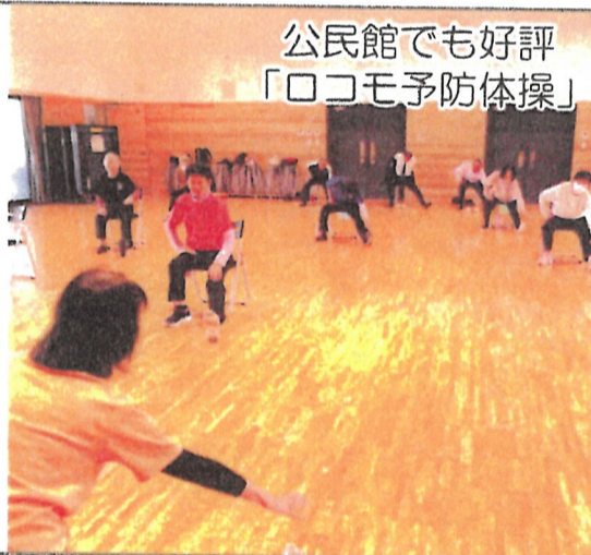
公民館でも好評 「ロコモ予防体操」

たかだてSCではスポーツ、健康に関する「出前教室」を行っています。ご希望日時や場所、参加人数、実施したいメニュー(フィットネス各種、ロコモ体操、軽スポーツ)など事務局へご連絡下さい。特に各町内会や公民館事業の新年度事業にいかがですか?お待ちしております!