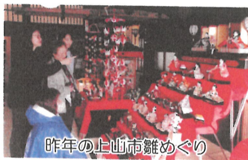
昨年の上山市雛めぐり

2/8 いつまでも自分の足で歩くために… 正しいウォーキングと、靴の選び方など学ぶ ※当初の予定を変更し、理学療法士の方を招いた座学講習会を 大山コミセンで開催します