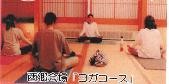
西郷会場「ヨガコース」