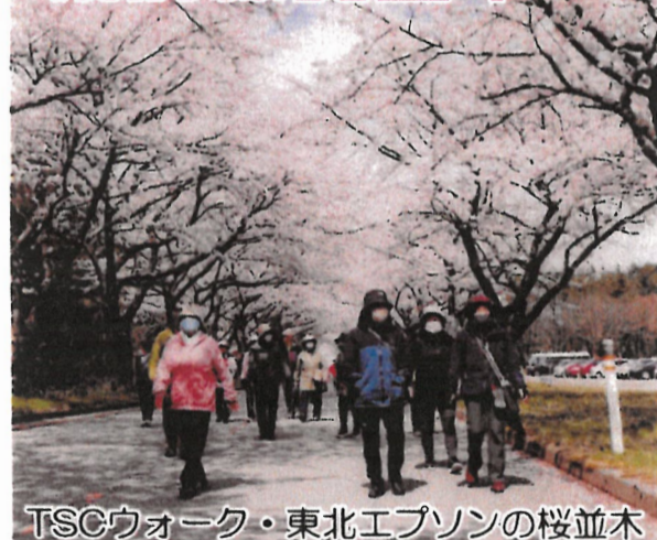
TSCウォーク・東北エプソンの桜並木