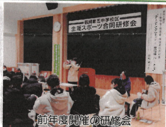
前年度開催の研修会

●申込他 クラブやスポーツ少年団、体協、鶴五中部活動コースなど、鶴五中学区のスポーツ等に関心のある方、どなたでも参加可。参加希望の方は2月9日(金)まで、クラブ事務局か、4地区コミセン担当者まで(参加は動きやすい服装で、内履持参)