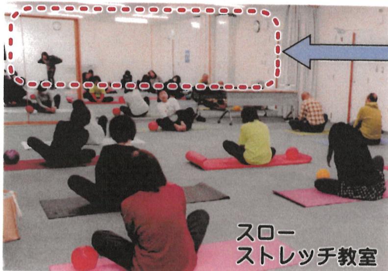
スロー ストレッチ教室

大山コミセン旧施設解体工事のため、1月より駐車場の利用スペースが制限されています。お近くの方はできるだけ徒歩か自転車でおいで下さい。また混雑時や夜間の際は、他の車や障害物に注意して停めて下さい