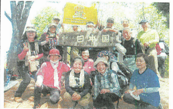
5/5 555m日本国トレッキング

7/23 六十里越街道 朝日~月山 ◎ 夏山シーズンを楽しむ たかだてSCおなじみの六十里越街道シリーズ。詳細は6月中旬にお知らせします